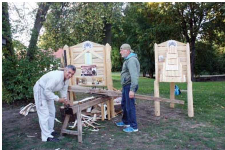
Stogdengiai iš Lekėčių demonstravo senąjį savo amatą