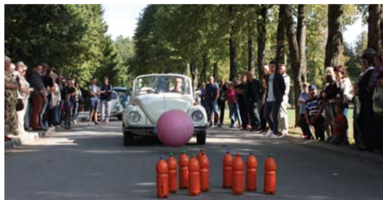
Senieji „vabalai“ žaidė boulingą ir jiems puikiai sekėsi!