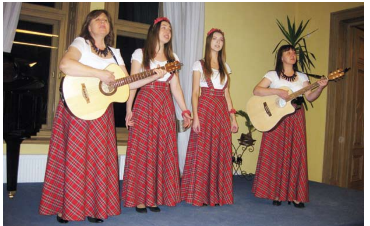
Renginyje netrūko skambių dainų ir geros nuotaikos. Koncertuoja Mamų ir dukrų kvartetas.