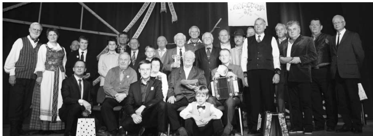
Nuotrauka atminčiai – „Gelgaudiškio armonikos 2015“ dalyviai ir komisijos nariai

Spalio pabaigoje į Gelgaudiškio kultūros centrą rinkosi armonikieriai iš visos Lietuvos – mūsų miestelyje jau 15-ą kartą vyko etnografinių regionų šio muzikos žanro mėgėjų čempionatas „Gelgaudiškio armonika 2015“.