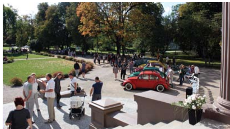
Dvaro dieną vienas po kito prie dvaro sugarmėjo nedidukai, spalvingi Kauno klubo VW automobiliai