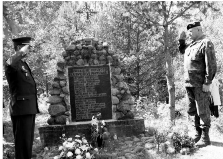
Atminimo paminklas Valkų kaivoje žuvusiems partizanams atminti