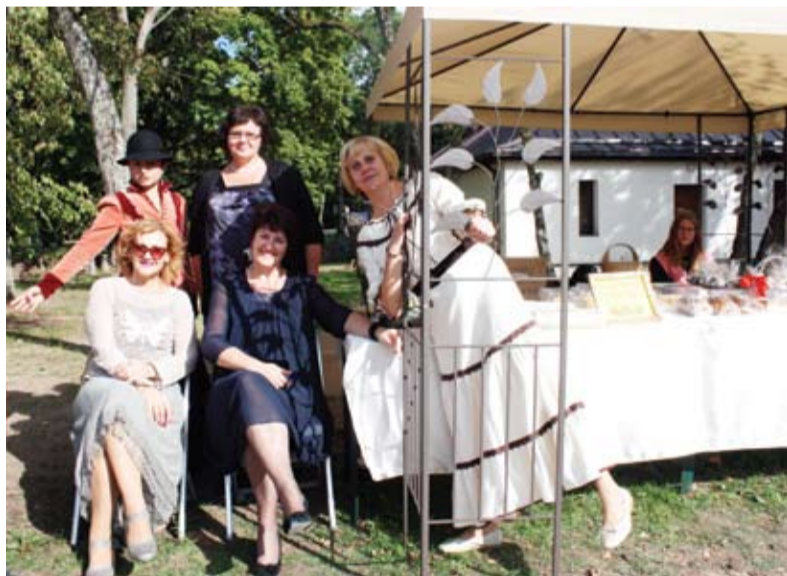
Puikiai nusiteikūsios gelgaudiškietės