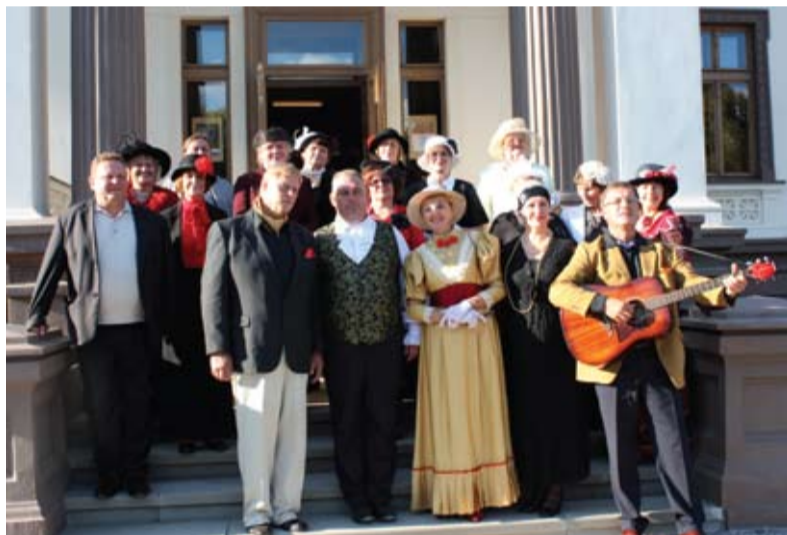
Orūs, pasipuošę ir pasitempę svečiai iš Šventupės dvaro