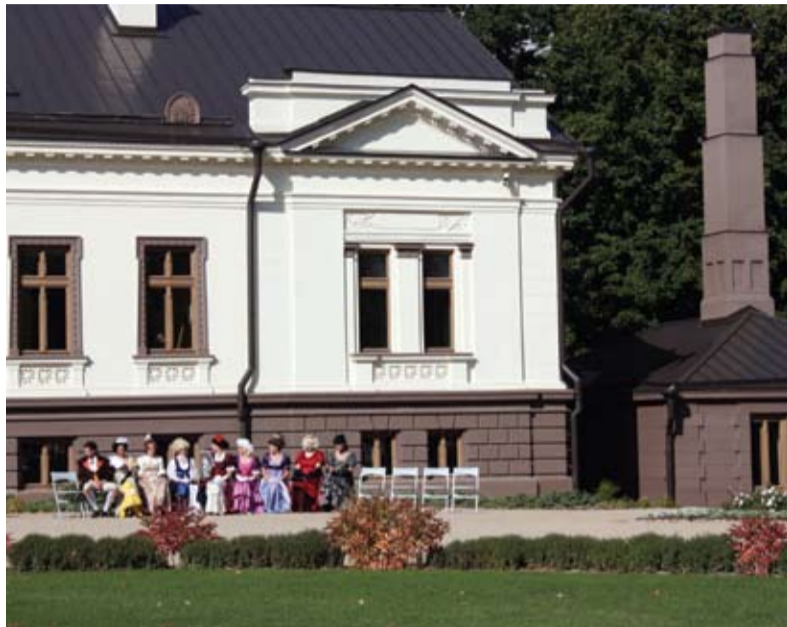
Kidulių dvaro ponios, išikūrusios saulutėje...

Rugsėjo 19-ąją, trečiąjį šio mėnesio šeštadienį, Gelgaudiškio dvare šurmuliavo tradicinė Dvaro diena. Ši šventė surengta jau dvyliką kartą ir šiemet buvo skirta kelionių temai, sulaukta svečių iš kaimyninių ir giminingų dvarų. Tai gelgaudiškiečių ir miestelio svečių šventė, skatinanti keliauti, pažinti savą kraštą ir jo istoriją.