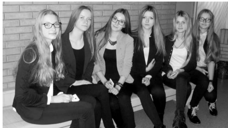
„Protų kovos“ dalyvės

Finalinės kovos vyko pagal amžiaus grupes, kurių buvo keturios: po 2 grupes 10-14 metų ir 15-18 metų amžiaus moksleivių. Kiekvienoje grupėje buvo apie 30 mokyklų. Komandos turėjo įveikti penkis turus – atsakyti į anksčiau minėtus klausimus. Taip pat atsakinėjo į klausimus apie neigiamą diskriminaciją dėl lyties, amžiaus ar religinių išitikinimų. Šios problemos opios visame pasaulyje, ne išimtis ir Lietuva: senjorai ir neigalieji – itin pažeidžiami asmenys – mūsų šalyje iš visų socialinių grupių patiria didžiausią neigiamą diskriminaciją; moterys gauna mažesnius atlyginimus nei vyrai ir rečiau užima vadovaujančias pozicijas, o smurtas prieš jas vis dar suvokiamas kaip „šeimos dalykas“, į kurį nedera kištis aplinkiniams.